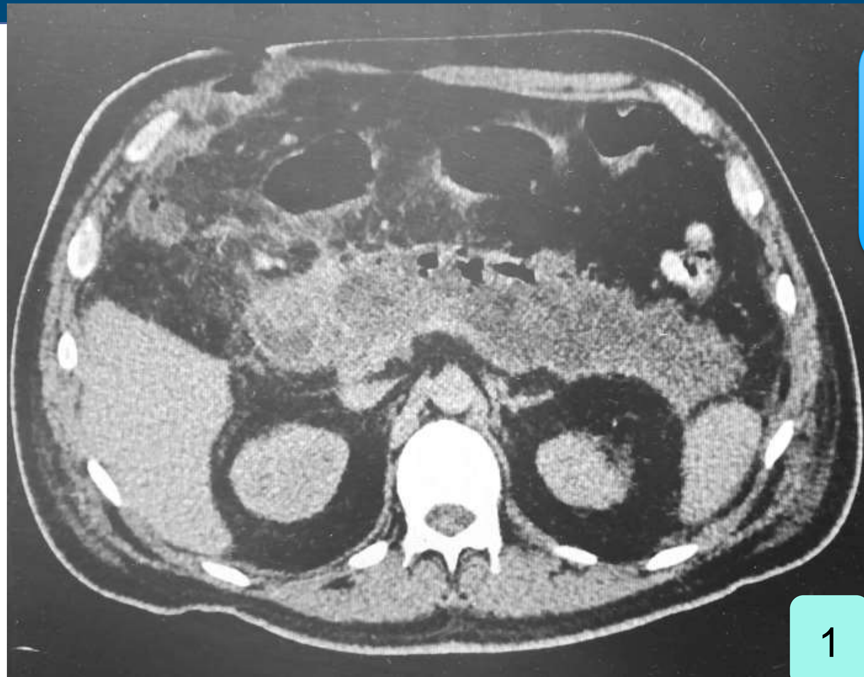
Figura 1 Tomografía de Abdomen a su ingreso: que muestra necrosis páncreas y gas en el mismo.