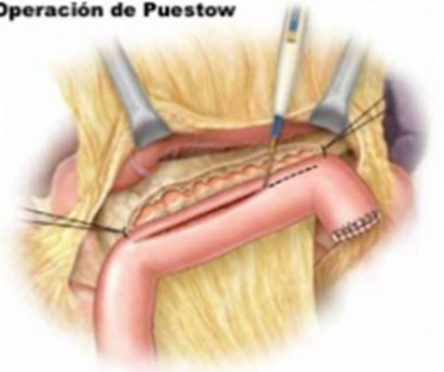
Figura 1 Procedimiento de Puestow