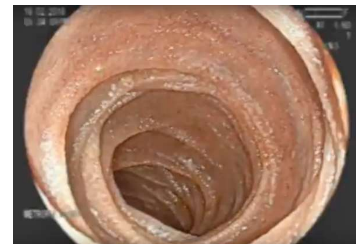
Figura 1, 2 y 3 Enteroscoia tranquirúrgica